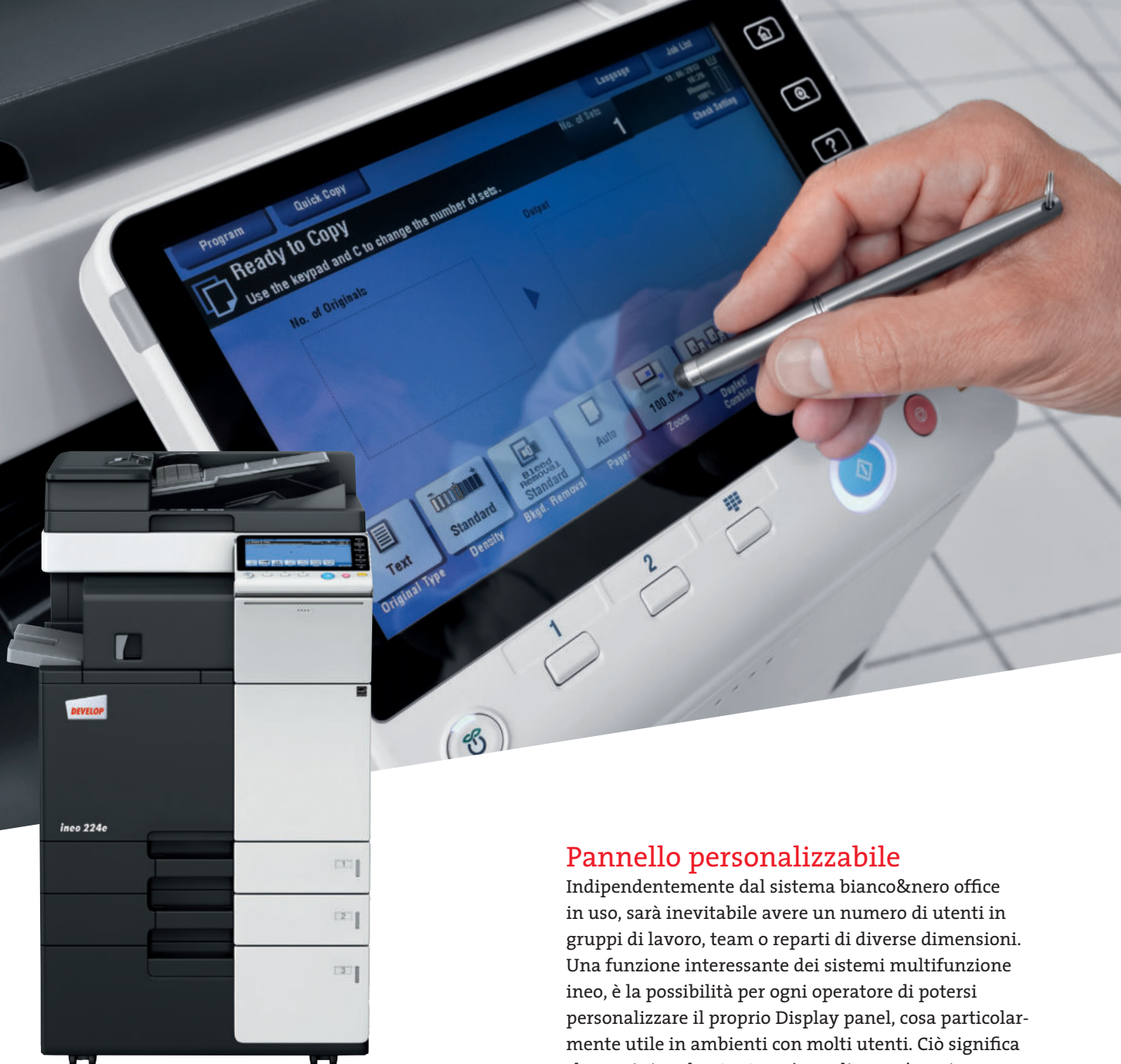
ineo 224e con alimentatore originali duplex (DF-624), inner Finisher (FS-533) e mobiletto ad alta capacità carta (PC-410)