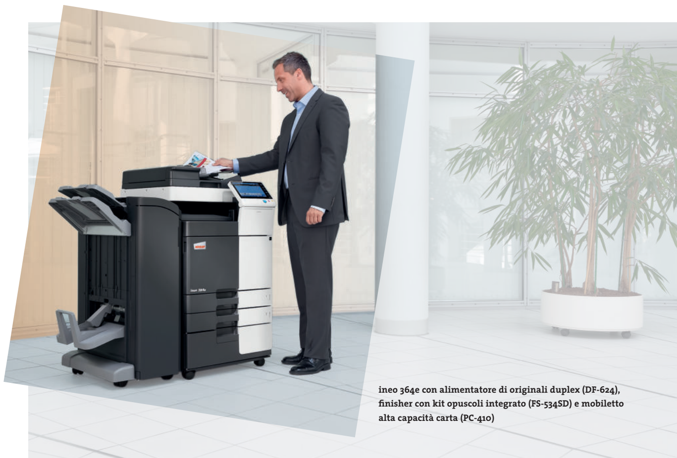
ineo 364e con alimentatore di originali duplex (DF-624), finisher con kit opuscoli integrato (FS-534SD) e mobiletto alta capacità carta (PC-410)

Questi sistemi in monocromia offrono numerose funzionalità energy-saving che permettono di tagliare l'assorbimento energetico fino al 40% se comparati con i modelli precedenti. Mentre questo tipo di economia aiuta a risparmiare denaro, altre funzioni "green" consentono benefici dal punto di vista ecologico. Ciò significa che la gamma DEVELOP ineo non solo salvaguarda l'ambiente ma è in grado di incrementare le credenziali "green" di chi la utilizza.