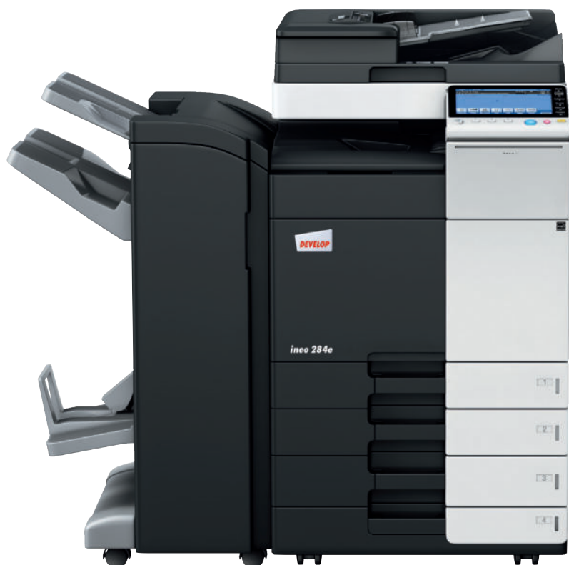
ineo 284e con alimentatore originali dual scan (DF-701), finisher pinzatore da 50ff con kit opuscoli integrato (FS-534SD) e mobiletto con 2 cassette carta (PC-210)

Ogni sistema multifunzione office – ineo 224e, ineo 284e e ineo 364e – non è solo eccezionalmente semplice da usare, ma offre anche un'ampia gamma di funzioni in grado di facilitare l'attività quotidiana tipica di ogni ufficio. Risparmiando tempo nei lavori di stampa, copia o scansione, gli utenti saranno aiutati a svolgere al meglio il proprio lavoro, e anche la produttività ne avrà un beneficio.