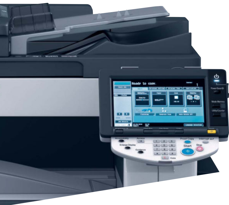
Display touch screen a colori di ineo 223, semplice da utilizzare

L'elevata qualità di stampa, unita a una vasta gamma di funzioni di finitura, consente la stampa interna di documenti aziendali professionali, come per esempio brochure. Se si aggiungono anche le funzioni di bucatura e pinzatura, la produttività dell'ufficio sarà ancora maggiore.