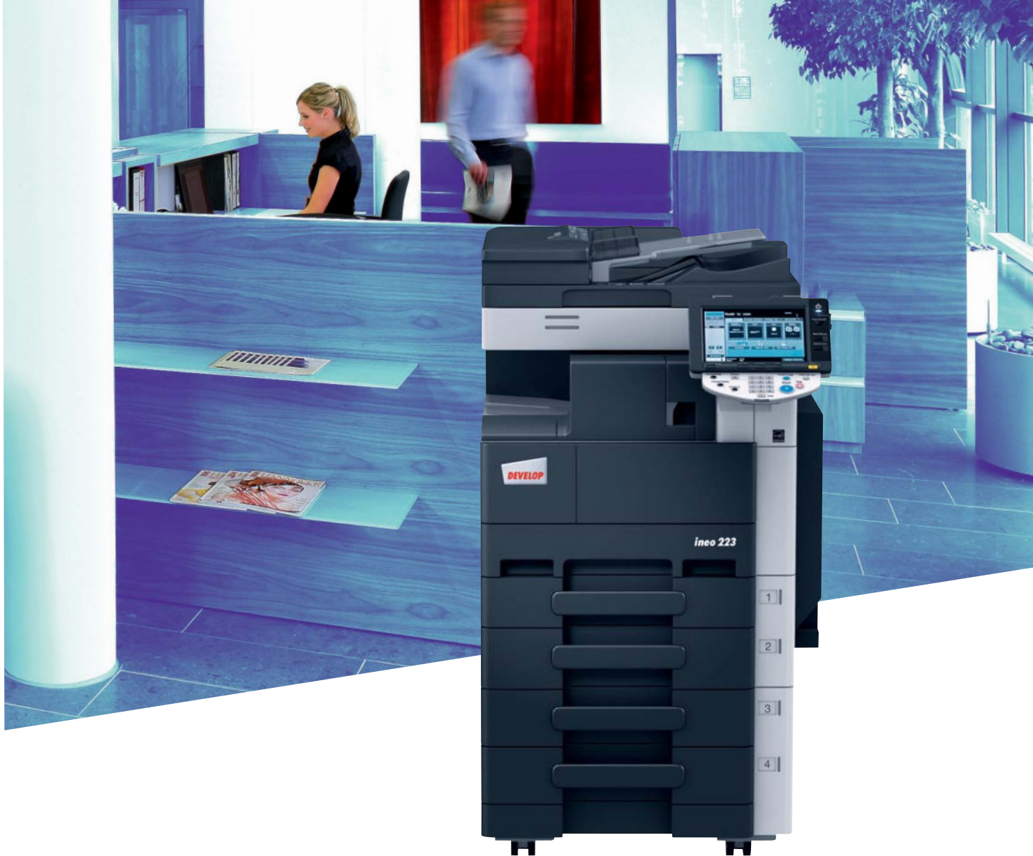
ineo 223 con finisher incorporato (FS-529), cassetto carta (PC-208) e alimentatore originali (DF-621)