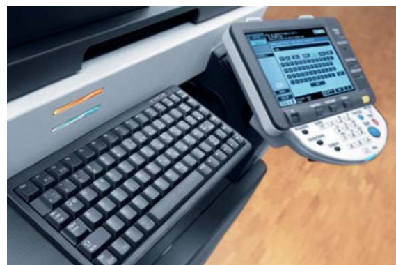
Display touch screen a colori e tastiera opzionale di ineo 223

Una squadra perfetta. I sistemi ineo 223/283 offrono grandi vantaggi per tutte le attività di stampa e copiatura in bianco e nero; i sistemi ineo+ a colori garantiscono invece una stampa a colori professionale: una combinazione conveniente per la produzione di documenti aziendali di alta qualità.