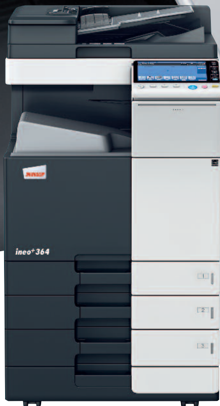
ineo con mobiletto con cassetto da 500 fogli (PC-110) e alimentatore originali Dual scan (DF-701)