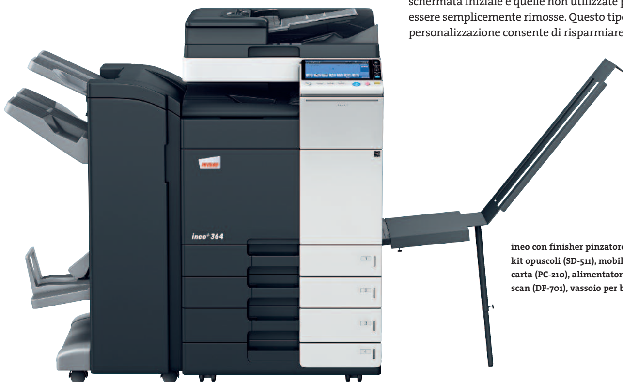
ineo con finisher pinzatore (FS-534), kit opuscoli (SD-511), mobiletto con 2 cassette carta (PC-210), alimentatore originali Dual scan (DF-701), vassoio per banner (BT-C1e)

Molti sistemi multifunzione per ufficio sono complessi da utilizzare. ineo+284, viceversa, è semplicissima. Un concetto di funzionamento semplice e intuitivo assicura una facilità d'utilizzo analoga a quella di uno smartphone o di un tablet. Il touchscreen capacitivo da 9 pollici è dotato di funzioni note come flick&drag e grazie a una nuova struttura di navigazione del menu è possibile visualizzare tutte le funzioni contemporaneamente e selezionare le impostazioni desiderate con pochi clic. Le funzioni utilizzate con maggiore frequenza possono essere lasciate sulla schermata iniziale e quelle non utilizzate possono essere semplicemente rimosse. Questo tipo di personalizzazione consente di risparmiare tempo.