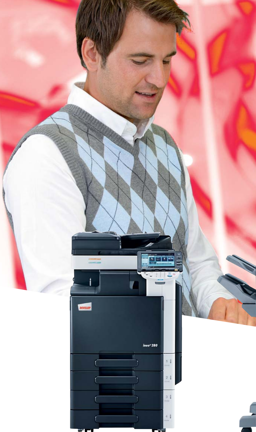
ineo+ 280 con alimentatore originali (DF-617), finisher interno (FS-529) e mobiletto con 2 cassette carta universali da 500 fogli (PC-207)