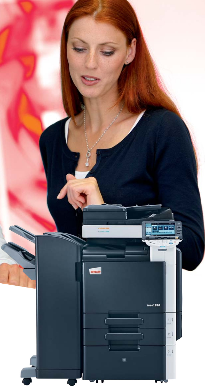
ineo+ 280 con alimentatore originali (DF-617), finisher a pavimento (FS-527) e Mobiletto ad alta capacità (PC-408)