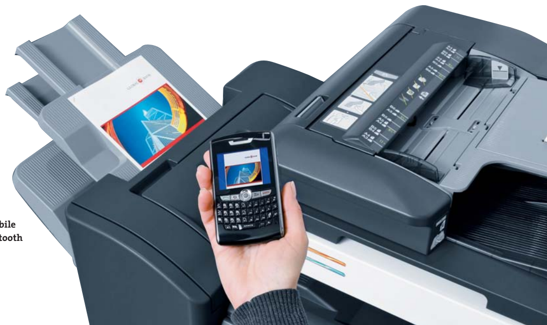
Stampa da dispositivi Mobile tramite connessione bluetooth opzionale